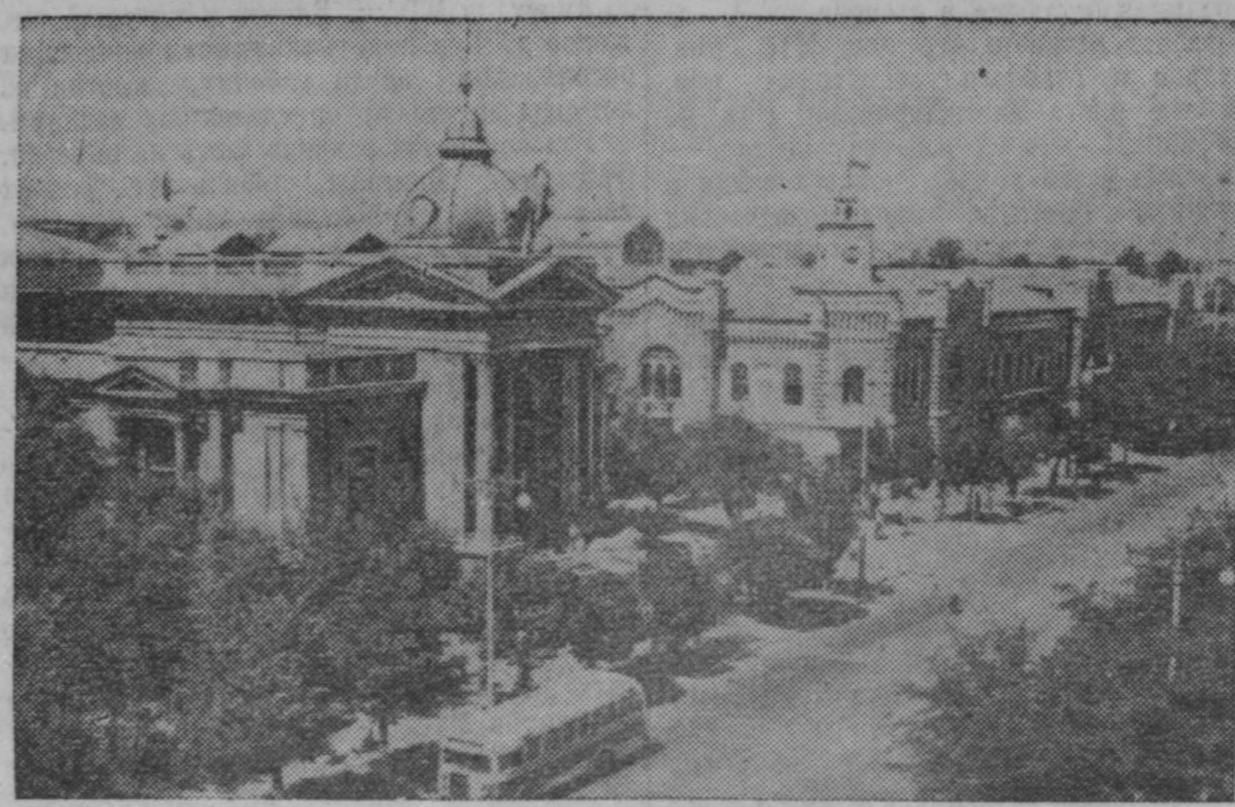
НА СНИМКАХ: 1. Кишинев, Проспект имени Ленина. 2. Сочи, Центральный корпус нового санатория ВЦСПС.