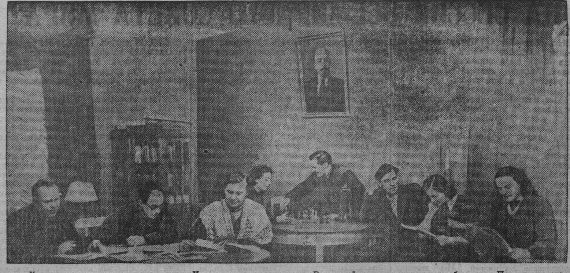
Хорошую инициативу проявило Кемеровское отделение Всероссийского театрального общества. При драмтеатре имени Луначарского открыт клуб актера. Здесь имеется хорошая библиотека. В клубе проводятся «снедельник», на которых для артистов читают лекции, организуют концерты коллективов, прибывающих в Кузбасс на гастроли. НА СНИМКЕ: в библиотеке клуба