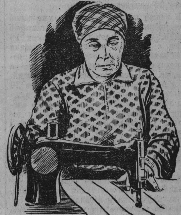
Коллектив Марининской промартели «Деятели» из месяца в месяц добивается хороших производственных достижений. План октября артель выполнила на 124,2 процента.