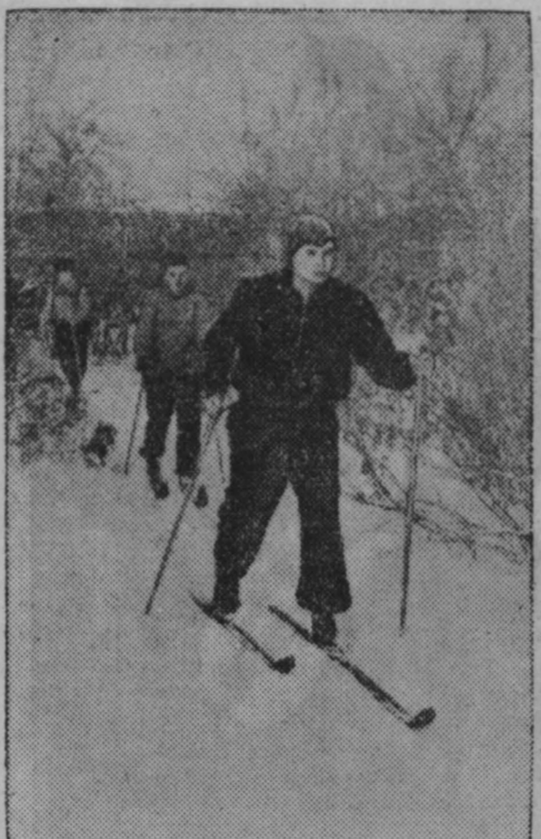
Началась спортивная зима. НА СНИМКЕ: спортсмены ДСО «Спартак» г. Кемерово на тренировке.