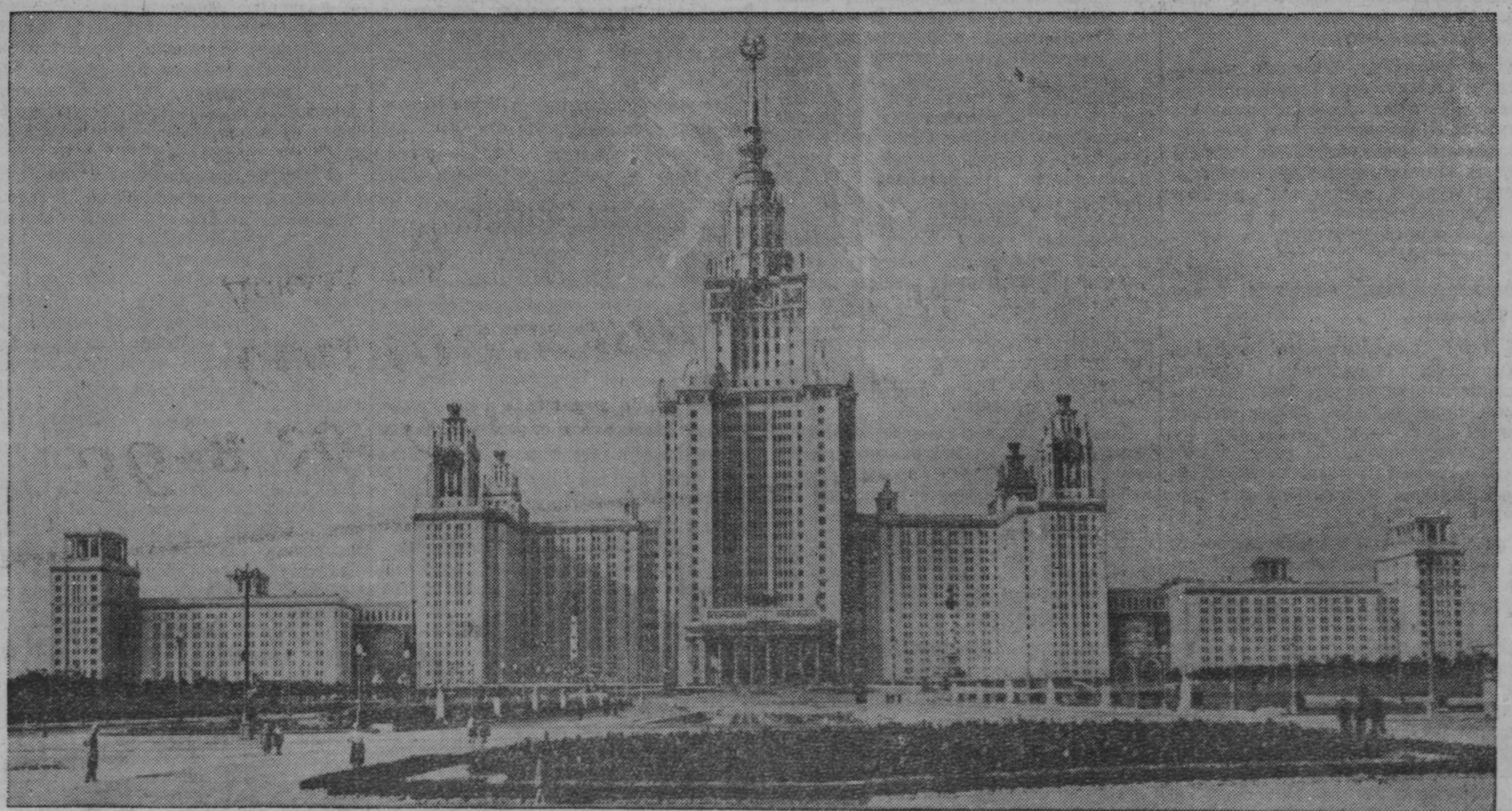
Московский государственный университет на Ленинских горах.