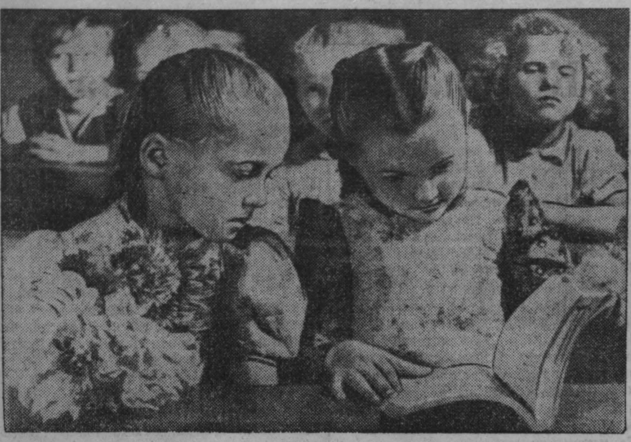
Правительство Венгрии уделяет много внимания развитию народного образования в стране. В 1952-1953 учебном году 99 процентов детей школьного возраста посещают учебные заведения. НА СНИМКЕ: на занятиях в неполной средней школе в комитате Ноград.