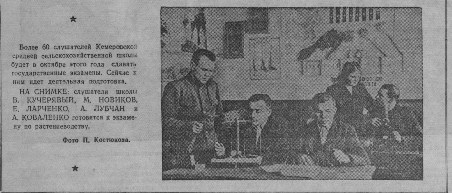
Более 60 слушателей Кемеровской средней сельскохозяйственной школы будет в октябре этого года сдавать государственные экзамены.

А. ДМИН, заместитель начальника отдела культурно-просветительной работы областного управления культуры.