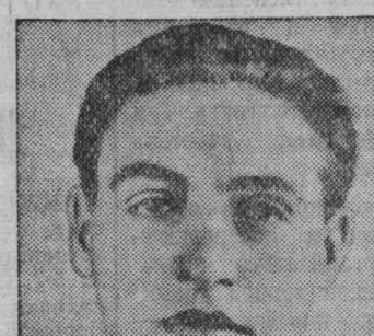
В декабре, то есть на два года раньше срока, я заканчиваю выполнение пятилетнего задания.

Через каждые 6 дней машину ставим в дело, где производится необходимый ремонт. Поэтому за все время работы у меня не было случая заборов вагонеток или азарий.