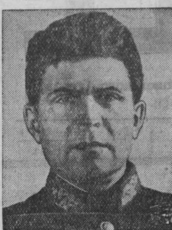
Я — старый горняк. У меня за плечами 20-летний стаж работы под землей.

Не могу не радоваться тем переменам, которые произошли за это время на нашем руднике. На окраине города, на месте прежних болот, поросших чахой травой, низких оврагами, высится небольшое опрятное домишко. Это рабочий поселок машиностроителей. Большой рабочий поселок вырос в районе шахты «Физкультурник».