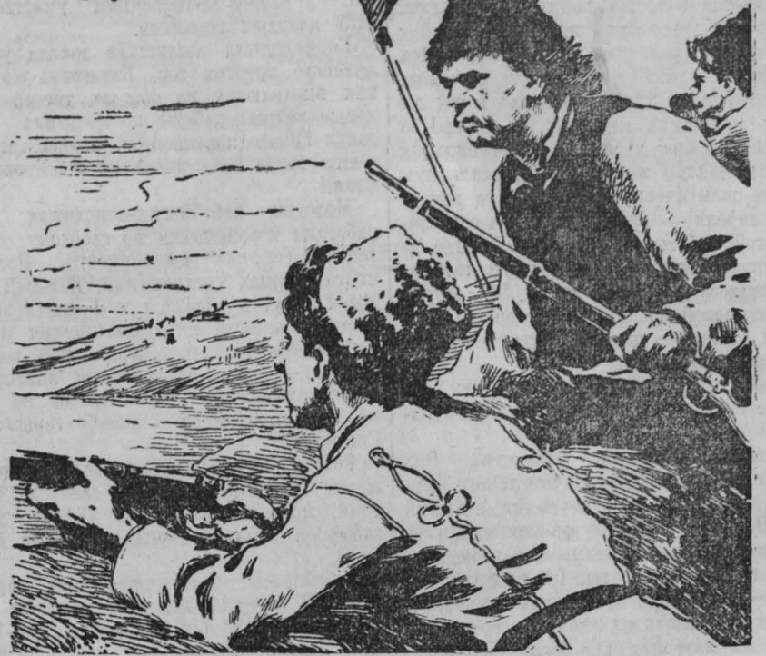
(по одноименному роману Ивана Вазова).

Производство Болгарской студии художественных фильмов.