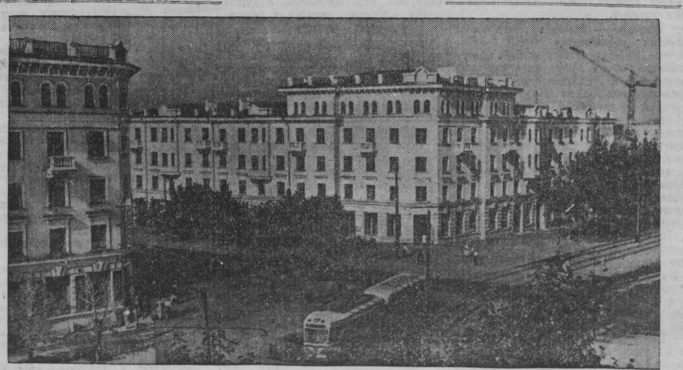
С каждым годом в Кузбассе все больший размах принимает жилищное и культурное строительство. В городах и рабочих поселках возводятся новые благоустроенные дома, замечательные дворцы культуры, клубы, школы. Недавно в гор. Кемерово, на Возовской улице сдан в эксплуатацию еще один новый 48-квартирный жилой дом для работников химической промышленности.