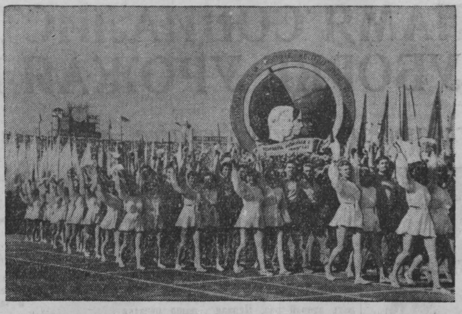
БУХАРЕСТ. В день открытия IV Всемирного фестиваля молодежи и студентов за мир и дружбу на стадионе имени 23 августа состоялся парад посланцев молодежи, прибывших из 106 стран мира. НА СНИМКЕ: делегация Международного Союза студентов на параде.

В последний день месяца на родину возвратилась делегация донецких шахтеров, выезжавшая в Кузбасс. Донбасовцы устроили ей теплую встречу. Они с интересом слушают рассказы своих посланцев о жизни и быте кузнецких шахтеров, об их достижениях и передовых методах работы.