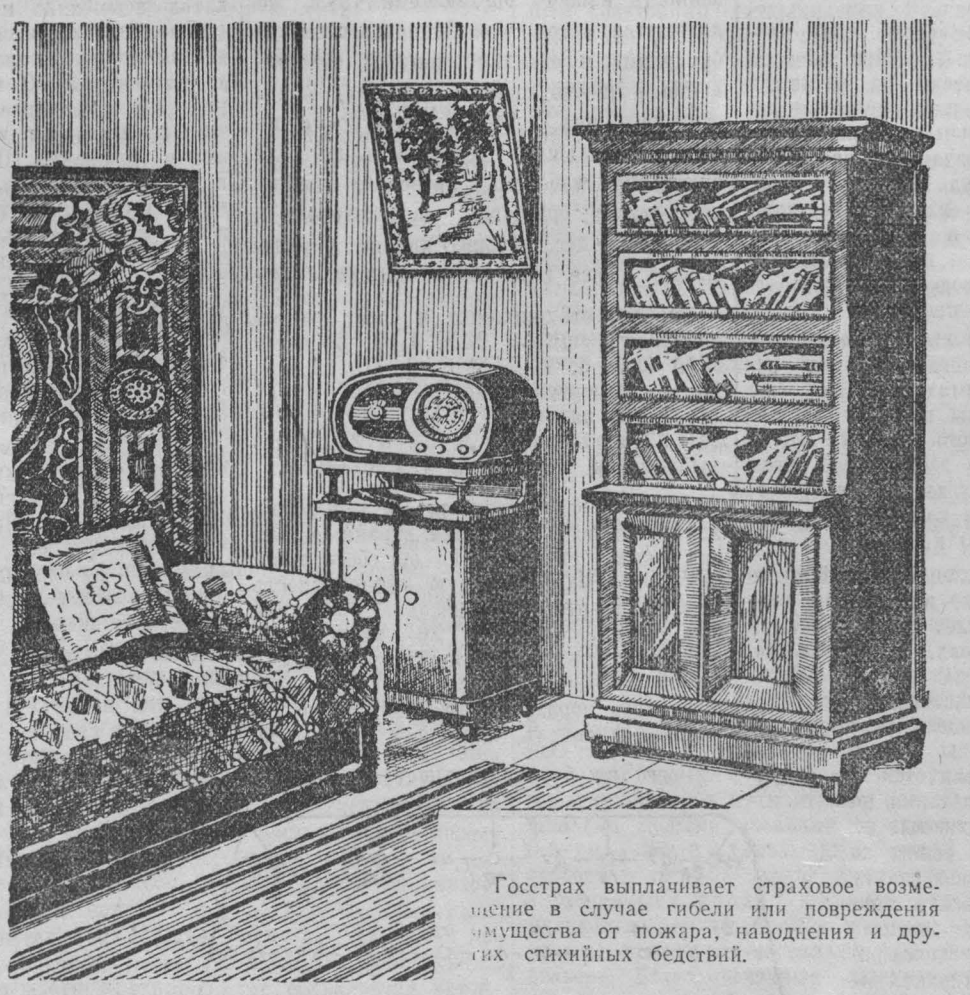
Госстрах выплачивает страховое возмещение в случае гибели или повреждения имущества от пожара, наводнения и других стихийных бедствий.

Для заключения договора страхования обращайтесь в инспекцию или к агенту госстраха.