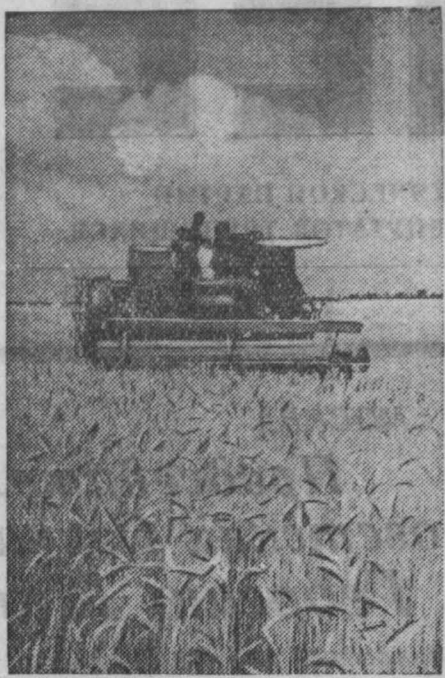
На юге страны полным ходом идет уборка нового урожая. НА СНИМКЕ: комбайновая уборка зерновых в Грузии.

Собрание актива закончилось пением партийного гимна «Интернационал». (ТАСС).