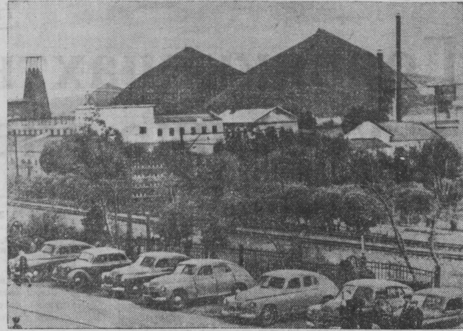
С каждым месяцем растет число шахтеров Прокопьевска, имеющих в личном пользовании легковые автомашины. НА СНИМКЕ: личные автомашины горняков у шахты им. Сталина.

Около 1 тыс. деревень, расположенных на берегах трех рек в восточной части Уттар Прадеш, также находятся под угрозой затопления. Уровень бурной реки Сабансири (Верхний Ассам) продолжает быстро подниматься, и в результате разлива этой реки уже затоплено около 600 кв. миль в районе Норт-Лакхмипура.