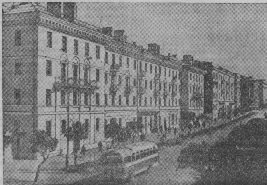
НА СНИМКАХ: 1. Новые жилые дома на Советской улице в Гомеле. 2. Дворец культуры при шахте «Южный коммунар» в Сталино.

Следую почину горняков шахты имени С. М. Кирова, славный коллектив пере- смотрел обязательство и решил выдать сверх плана ко Дню шахтера не 30, а 34 ты- сячи тонн угля. В счет этого обязательства к 15 июля уже добыто 28,574 тонны.