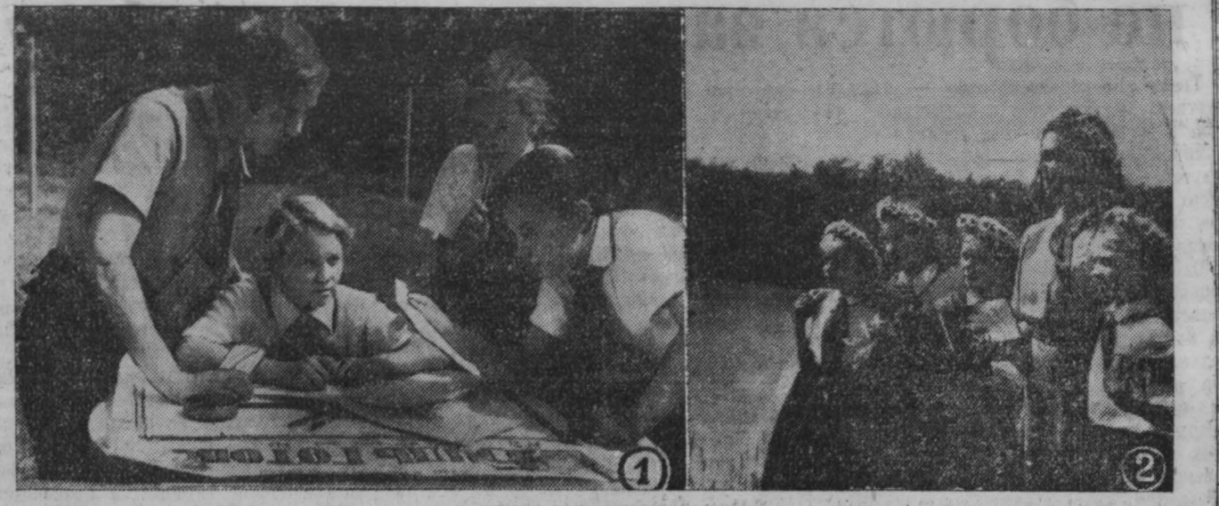
В разгаре пионерское лето. Сколько нового, интересного сулит оно ребятам. Сотни школьников Кузбасса совершают сейчас туристические походы по родному краю, участвуют в экскурсиях по историческим местам нашей великой Родины, любуются лугазарными звездами московского Кремля и красотой стройных улиц Ленинграда.

Тысячи школьников области отдыхают в пионерских лагерях, ...Сквозь густую зелень соснового бора, на живописном берегу широкой и быстрой Томи проглядывают аккуратные светлые домики. Тишина... Только разноголосное щебетание птиц иногда нарушает ее.