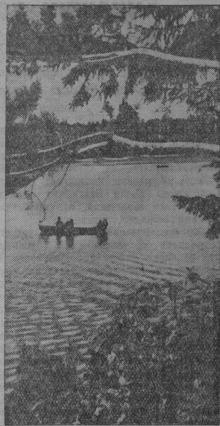
Зенковское озеро.