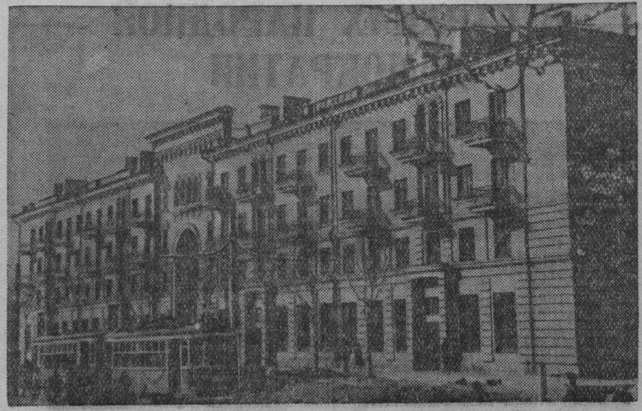
Растет и благоустривается город шахтеров — Прокопьевск. На снимке: новый 48-квартирный дом, построенный недавно для горняцкого коллектива шахты 3-3-Бис.