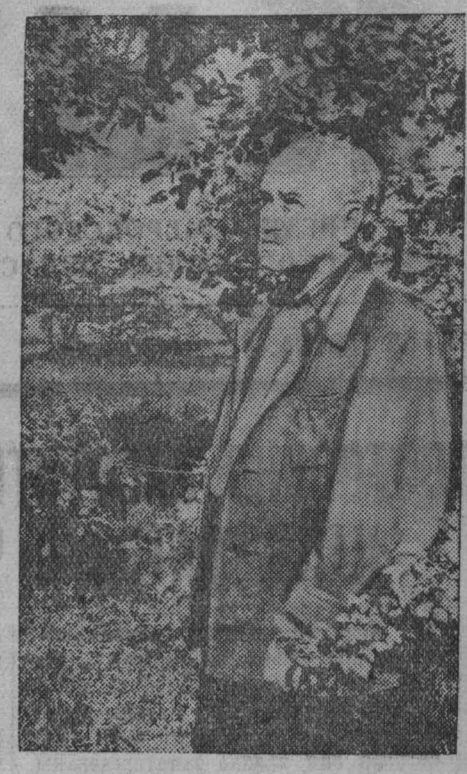
Десятки тонн разнообразных фруктов, ягод, ранних овощей ежегодно получают металлурги Кузнецкого комбината из совхоза «Салопарково».