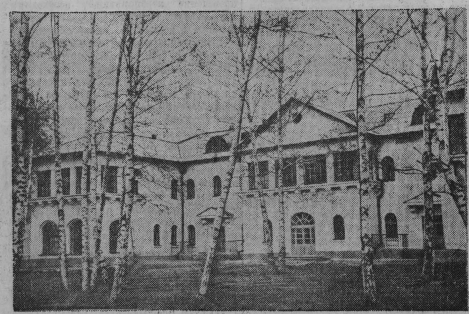
Для самых маленьких жителей областного центра в березовой роще Кировского района построены новые ясли. НА СНИМКЕ: новые детские ясли.

Коммунистическая партия и Советское правительство проявляют неустанную заботу о благе народа. В помешенных ниже материалах рассказывается о том, что делают советские, хозяйственные и другие организации нашей области для улучшения культурно-бытовых условий трудящихся Кузбасса.