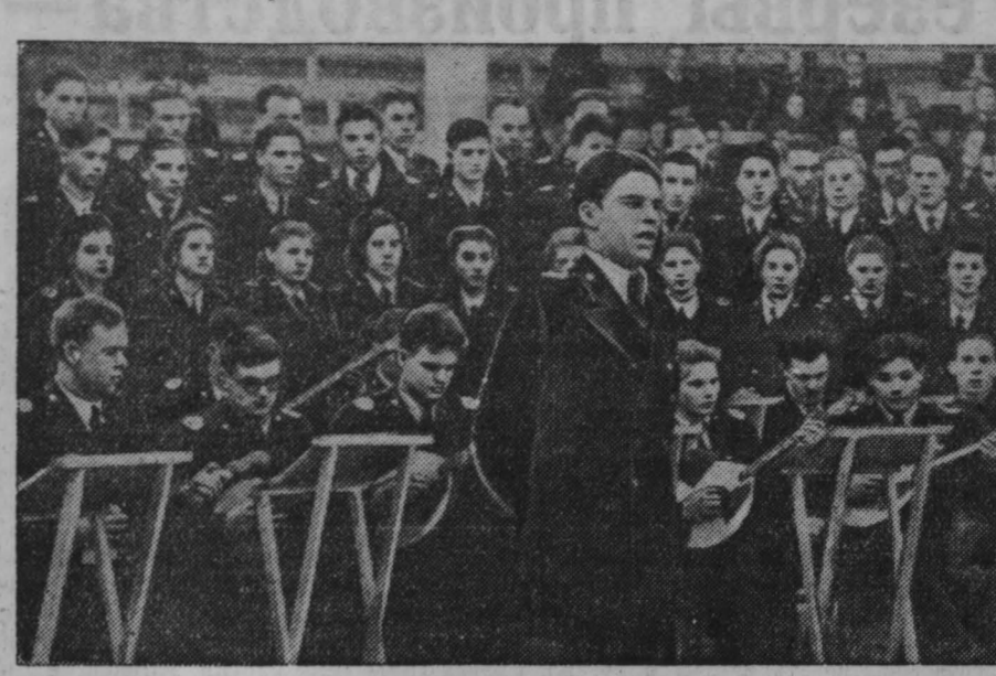
НА СНИМКЕ: выступление хора горного института.