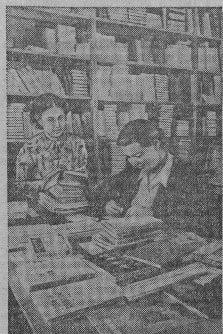
Советские научные и культурные учреждения ведут систематический обмен книгами и журналами с научными учреждениями Китайской Народной Республики.

десятилет подземного транспорта шахты «Бунгурские штольни» треста «Куйбышевуголь».