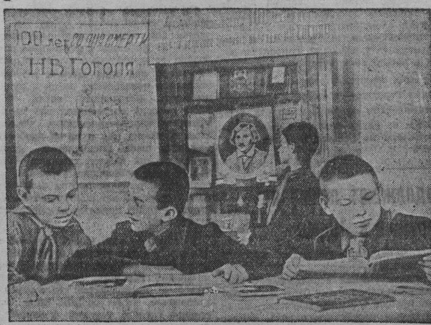
В читальном зале Кемеровской городской детской библиотеки. Школьники читают книги Н. В. Гоголя.