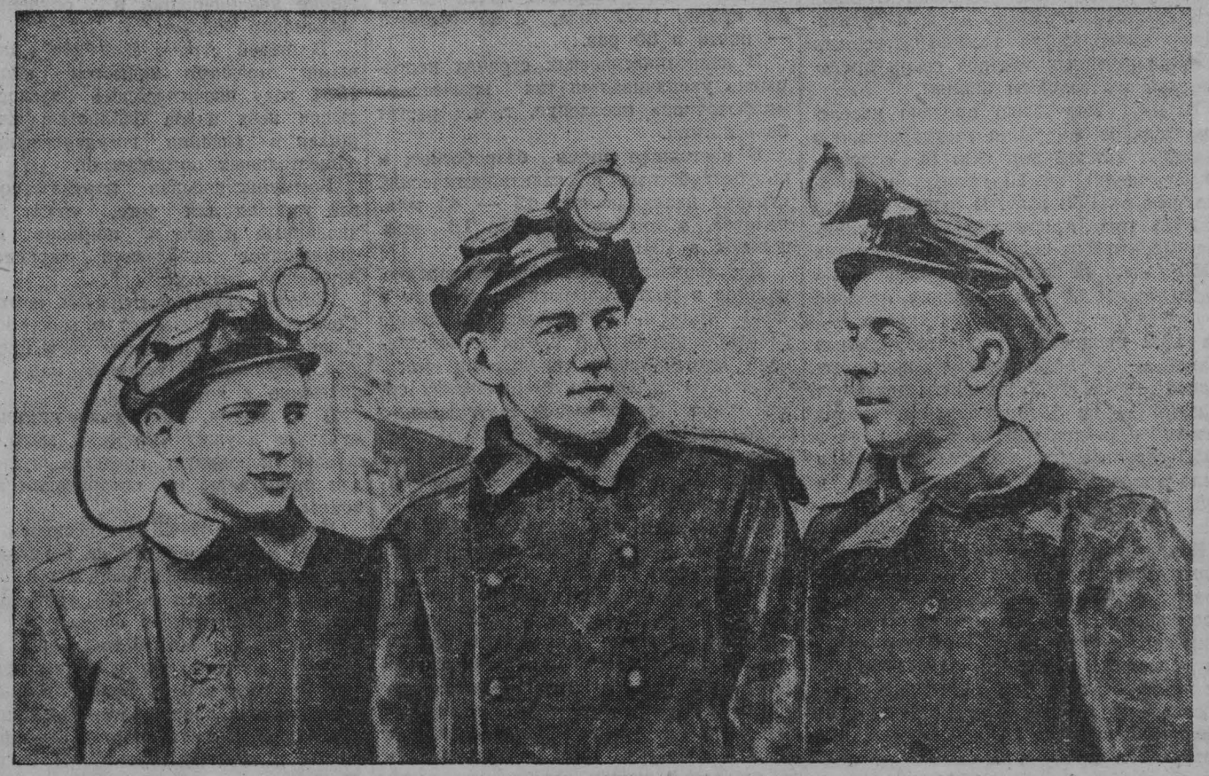
Комбайнеры шахты «Капитальная-1» Осинниковского рудника борются за повышение добычи угля. В социалистическом соревновании по профессиям механизаторы добиваются производительности 12 тысяч тонн на комбайн «Донбасс».

Под руководством партийной организации коллектив шахты с честью выполнит эти почетные задачи. («Правда», 25 II. 52 г.).