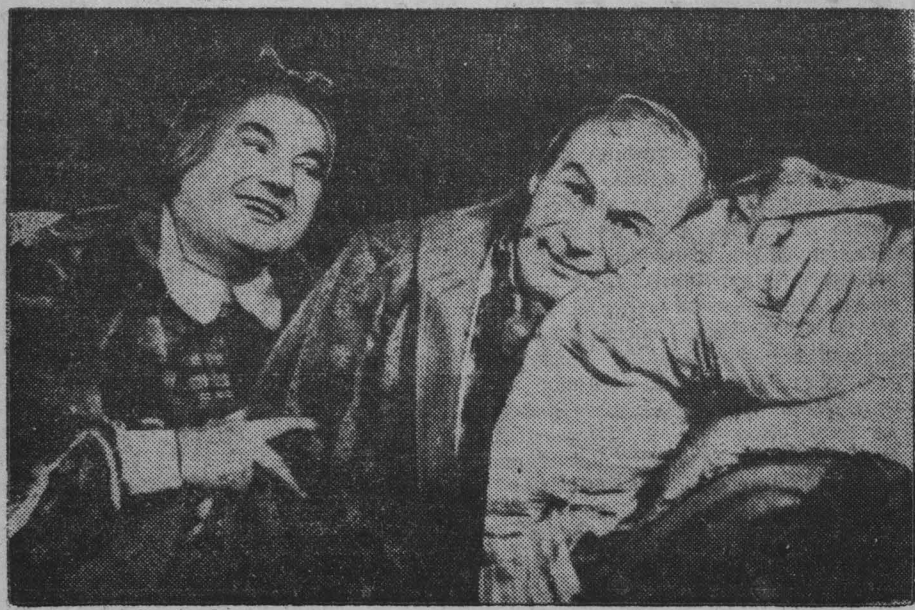
В Чехословацкой Республике с большим успехом ставятся комедии Н. В. Гоголя «Женитьба» и «Ревизор». Коллектив Национального театра в Праге показал комедию «Женитьба».