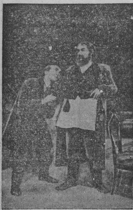
Чехословацкая Республика. Недавно в Словацком Национальном театре в городе Братиславе состоялась премьера комедии А. Островского «Свои люди сочтемся».