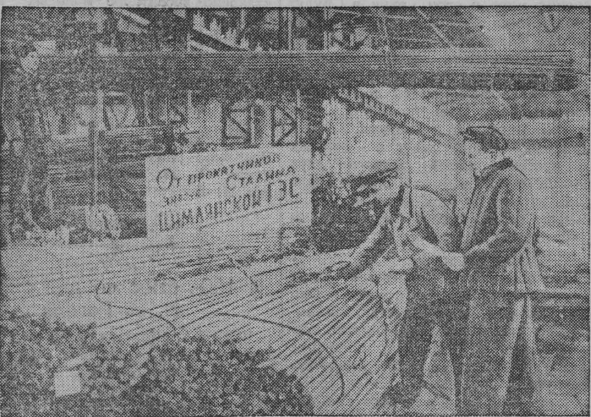
Сталин. Сортопркатный цех металлургического завода имени Сталина выполняет заказы для Цимлянского гидроузла. Прокатчики значительно перевыполняют производственные задания и выпускают продукцию отличного качества.