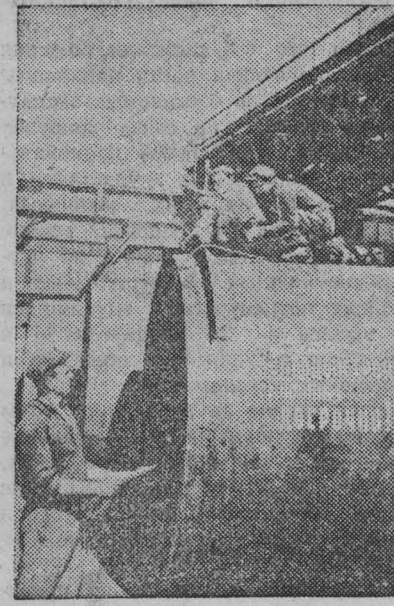
Сталинская область. Ждановский завод металлоконструкций изготавливает оборудование для шлюзов и насосных станций «Волгодонстроя».