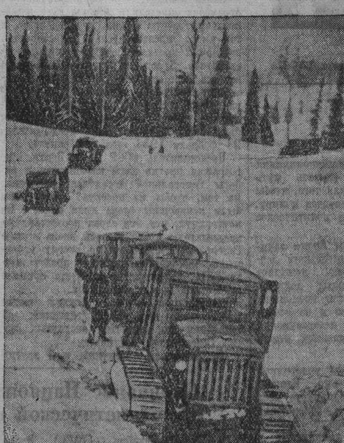
В первые месяцы стройки, когда подвесные дороги еще не были готовы, путь грузовым автомобилям прокладывали по снежной целине тракторы.