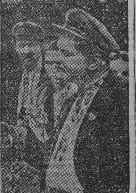
Председатель колхоза «Смерть капитализму» Чеснок (артист Л. МИЛОТЕНКО). Кадр из кинофильма «В степях Украины».