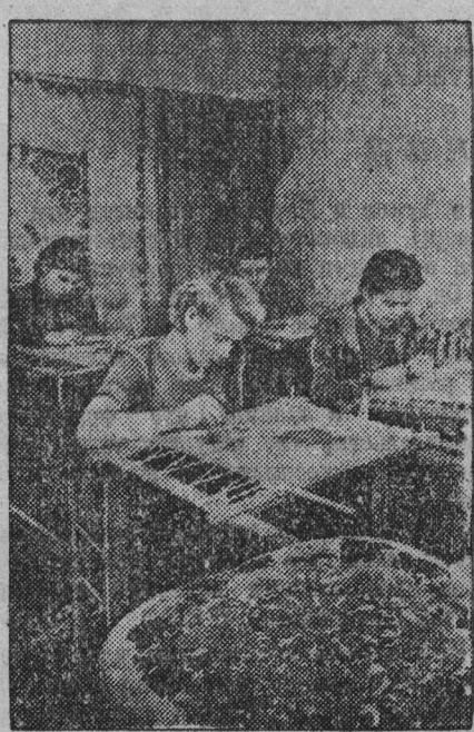
Московское художественно-промышленное училище имени М. И. Калинина готовит кадры специалистов-художников народных промыслов. За годы существования училище подготовило более 3 тысяч художников по ковроделию, вышивке, росписи по лаку и другим видам народных промыслов. Многие из окончивших училище работают художниками-мастерами в Палехе, Мстерах, Федоскино и Жостове.