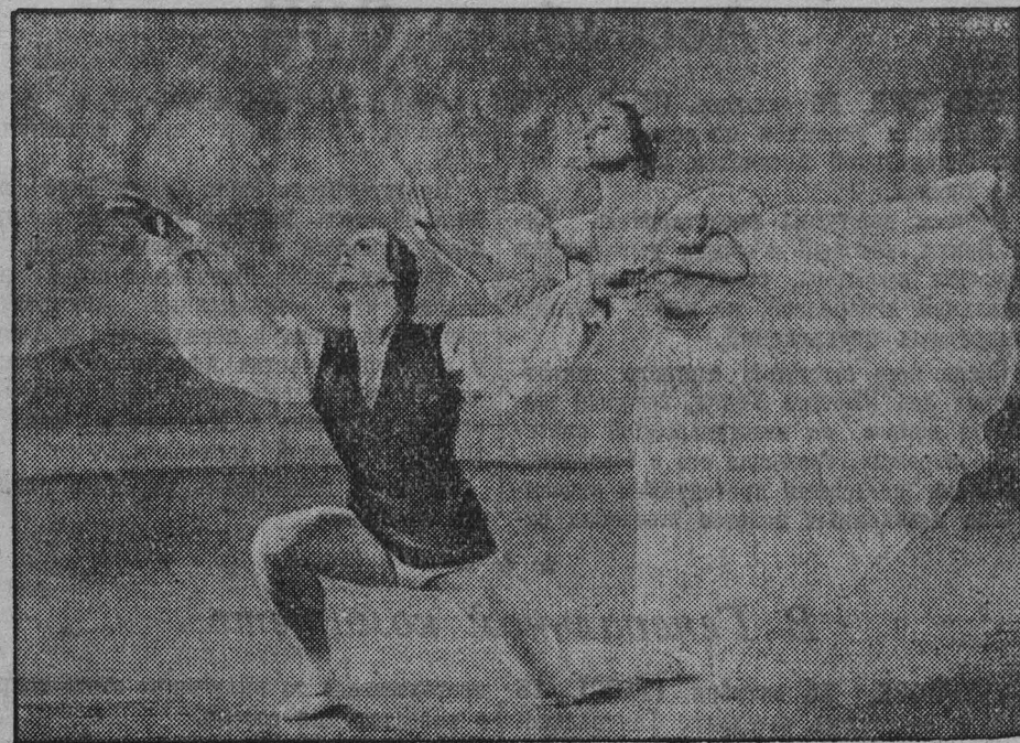
НА СНИМКЕ: кадр из фильма «Концерт мастеров искусств». Вальс Шопена в исполнении Г. УЛАНОВОЙ и В. ПРЕОБРАЖЕНСКОГО.

На спектакле или концерте присутствуют сотни зрителей. Кинофильм — смотрят миллионы. Вся советская земля от края до края — аудитория кинематографии. Вот почему за последнее время в нашем киноискусстве так успешно развивается новый жанр — фильм-спектакль, фильм-концерт. Они знакомят широкие массы трудящихся с крупнейшими мастерами оперы, балета, драмы, с выдающимися постановками ведущих театров страны.