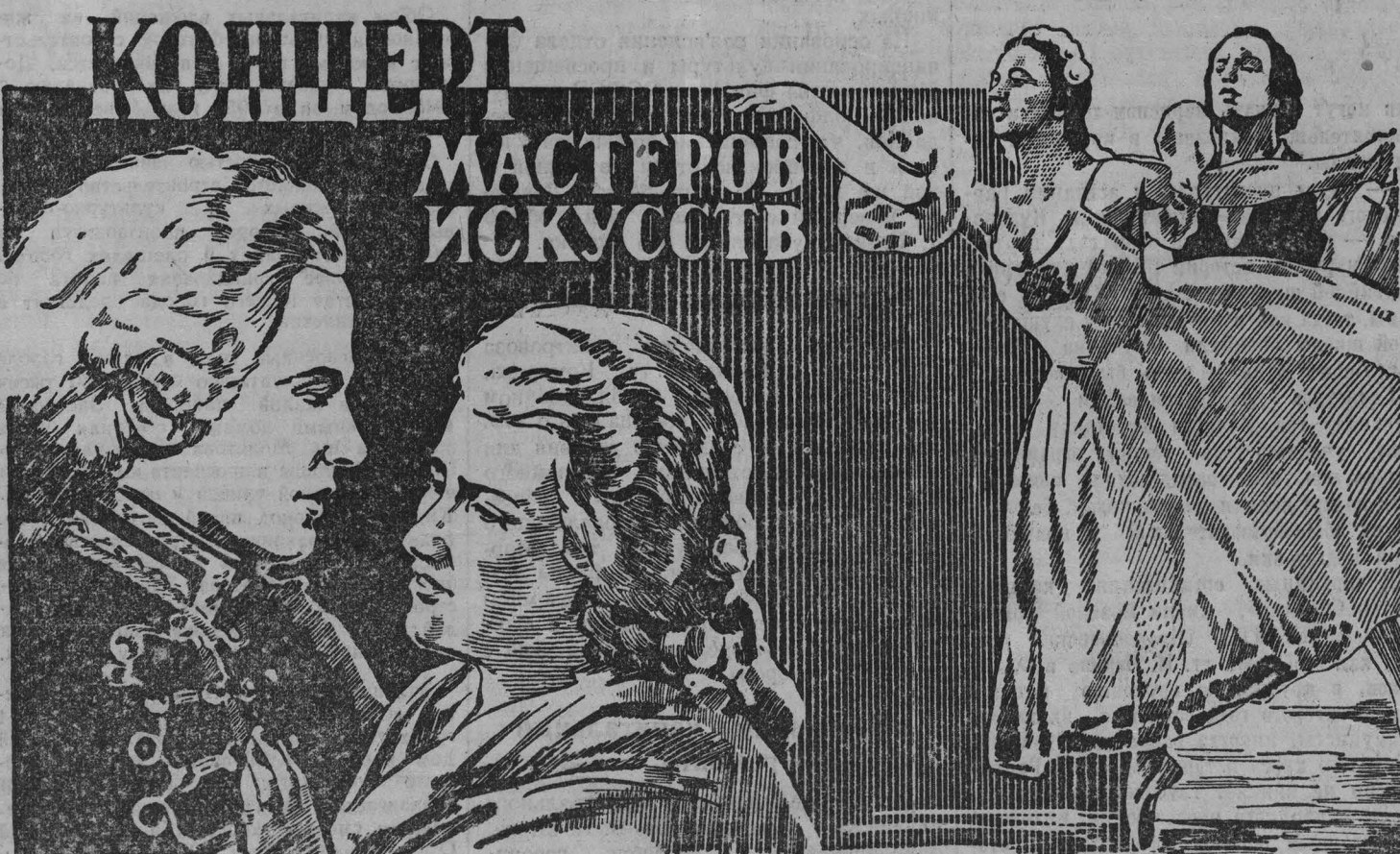
Выпуск „ГЛАВКИНОПРОКАТА“, 1952 год.

выпустила на экраны кинотеатров Кузбасса новый цветной художественный фильм