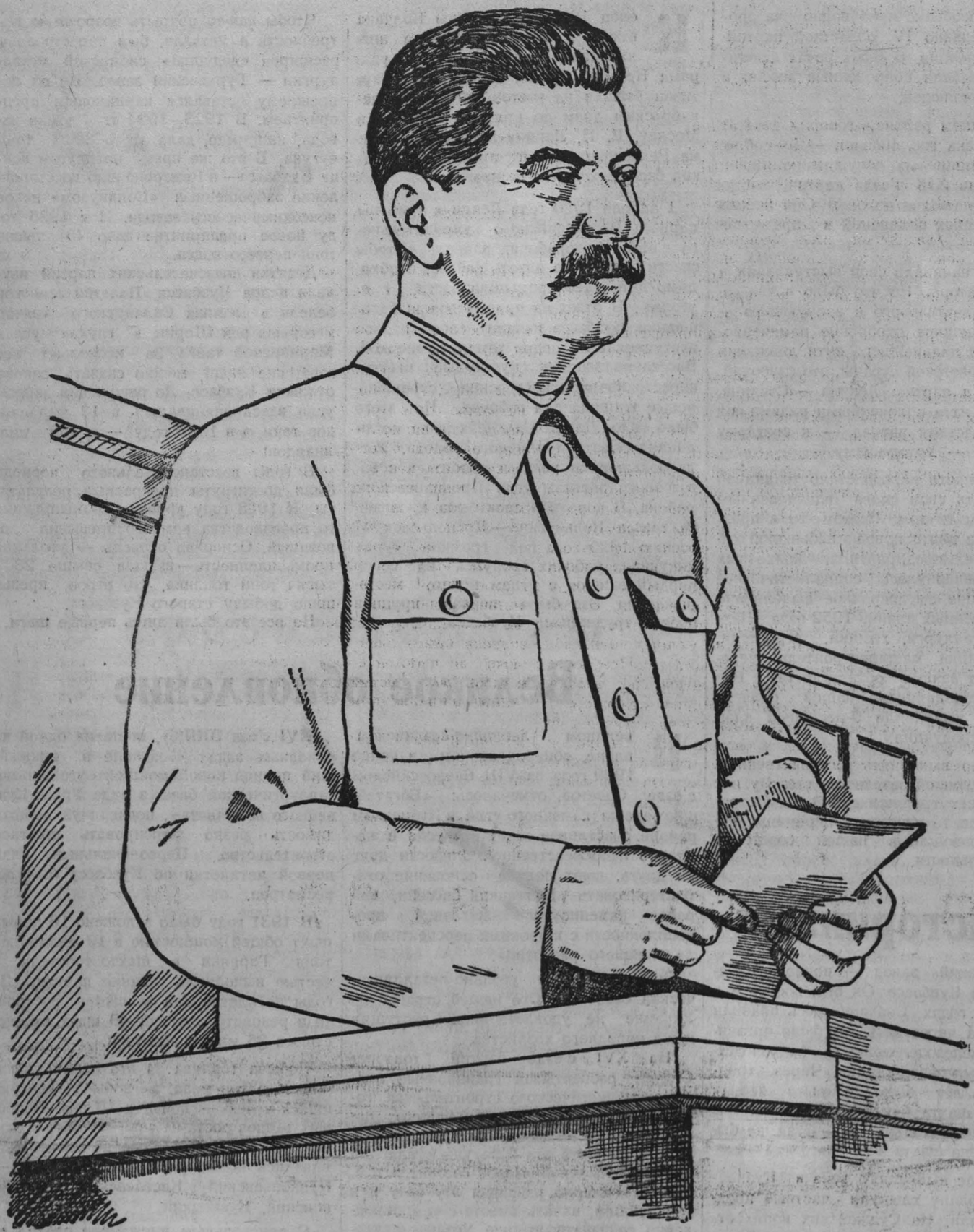
Иосиф Виссарионович СТАЛИН.