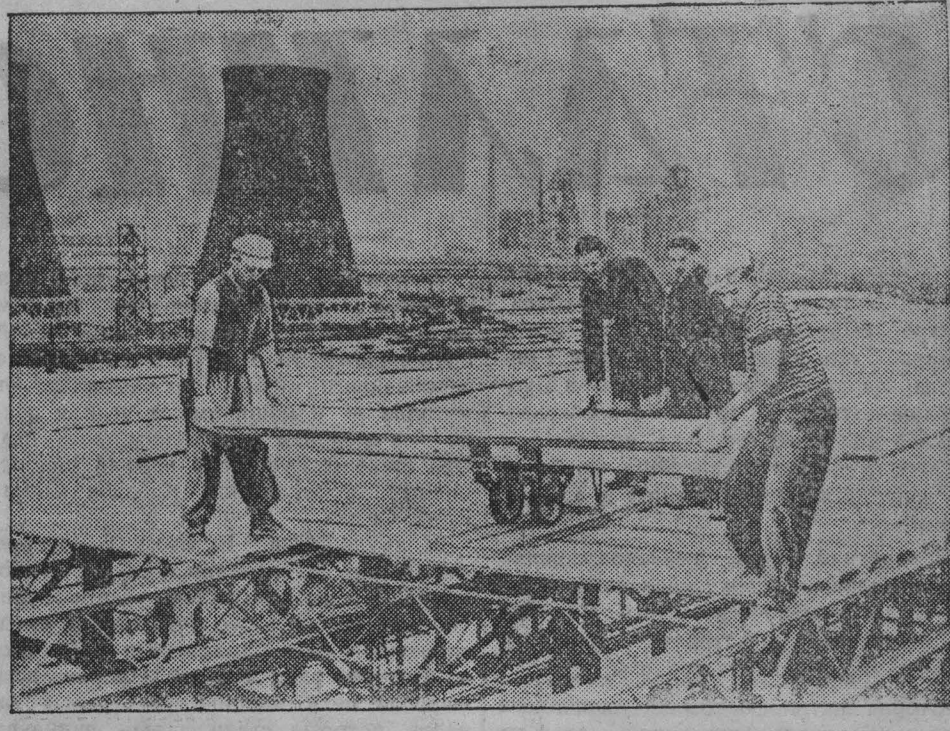
Чехословацкая республика. Строители металлургического комбината имени Клемента Готвальда, став на трудовую вахту в честь XIX съезда ВКП(б), первыполняют задания. НА СНИМКЕ: строительство прокатного цеха комбината.