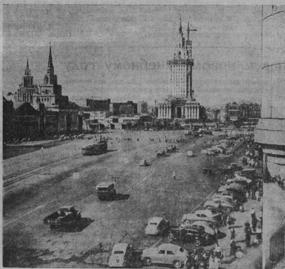
МОСКВА. Строительство высотного здания гостиницы на Комсомольской площади.