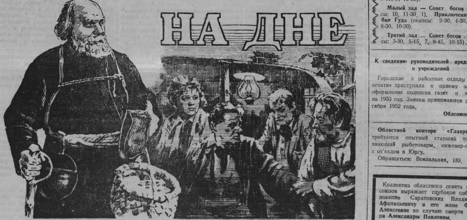
Выпуск „Главкинопроката“ 1952 года.

в ближайшие дни выпускает на экраны кинотеатров Кузбасса новый экранизированный спектакль Московского Художественного Академического театра имени М. Горького