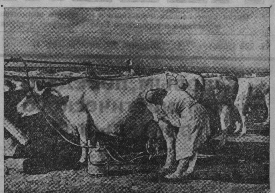
НА СНИМКЕ: механическая дойка коров в Ленинск-Кузнецком племенном совхозе.