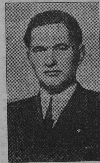
П. КЕРЕС, гроссмейстер.