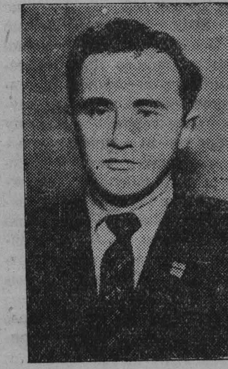
Е. ГЕЛЛЕР, гроссмейстер.