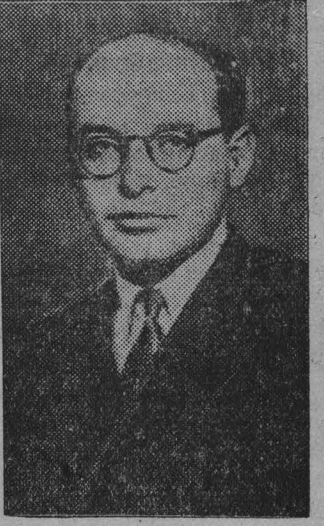
Д. БРОНШТЕЙН, гроссмейстер.