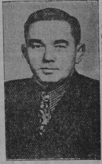
А. КОТОВ, гроссмейстер.

ХЕЛЬСИНКИ, 30 августа. (ТАСС). Сегодня в последний тур команды Советского Союза и Швеции встретились в следующем составе: Смыслов — Шталберг, Штольц — Бронштейн, Геллер — Лундин и Скельд — Болеславский.