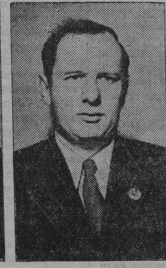
И. БОЛЕСЛАВСКИЙ, гроссмейстер.