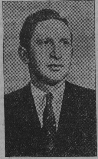
В. СМЫСЛОВ, гроссмейстер.