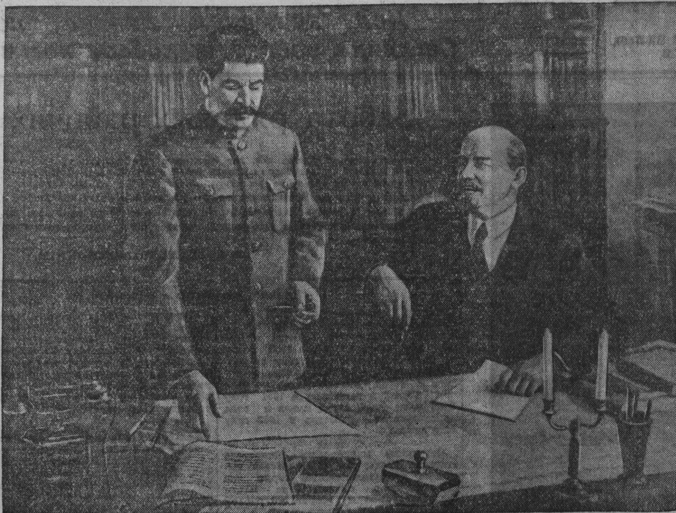
В. И. ЛЕНИН и И. В. СТАЛИН обсуждают план ГОЭЛРО.

В области политической империалистическая реакция означает переход от буржуазной демократии к открытой террористической диктатуре к фашизму.