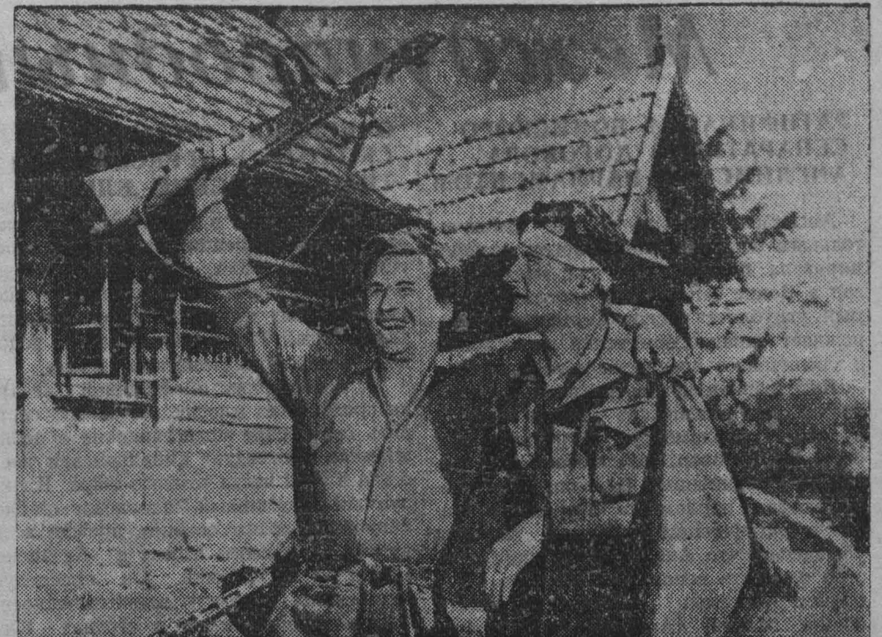
НА СНИМКЕ: кадр из кинофильма «Операция «Б»

Хорошо выполнено внешнее и внутреннее архитектурное оформление клубов. Они имеют зрительные залы на 400 мест, лекционные залы, просторные вестибюли и фойе, много комнат для кружковой работы, для занятий с детьми, спортивные залы, помещения для библиотек.