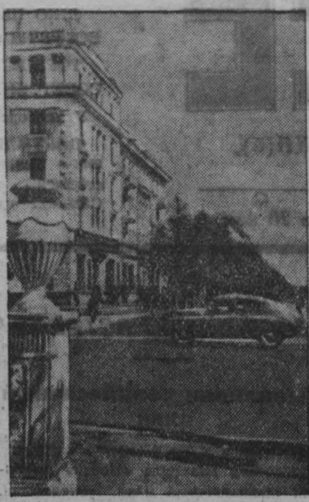
Гор. КЕМЕРОВО. Советская улица.