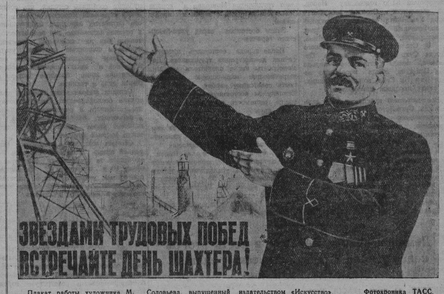
ЗВЕЗДАМИ ТРУДОВЫХ ПОБЕД ВСТРЕЧАЙТЕ ДЕНЬ ШАХТЕРА!

металлических клеток в верхней части лавы. Таким образом, уголь из лавы идет почти непрерывным потоком.