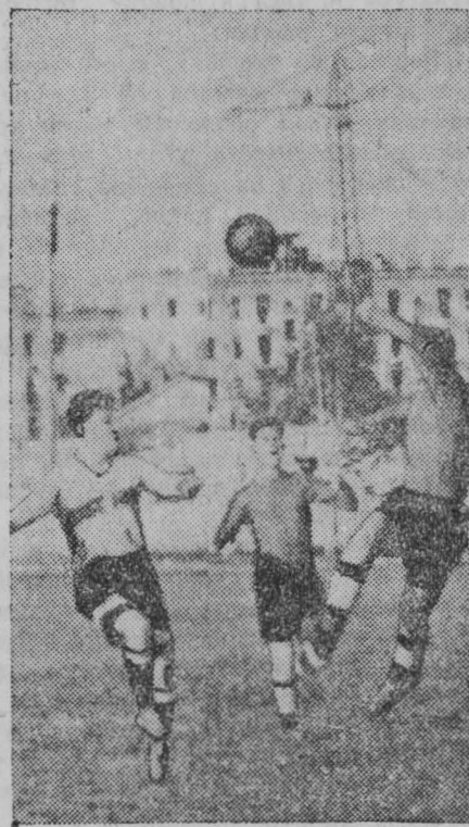
Знойный солнечный день, 36 градусов в тени... На небе — ни облачка. Ни малейшего дуновения ветерка. Но что жара для болельщика! Тысячи любителей футбола заполнили трибуны кемеровского стадиона «Химик».

Свисток судьи, и на поле выходят сильнейшие команды города — «Шахтер» и «Динамо». Идет очередная встреча по розыгрышу кубка РСФСР. На счету горняков — победа над алтайской и новосибирской командами. Динамовцы победили своих одноклубников из Барнаула и спортсменов «Металлурга» (Сталинск).