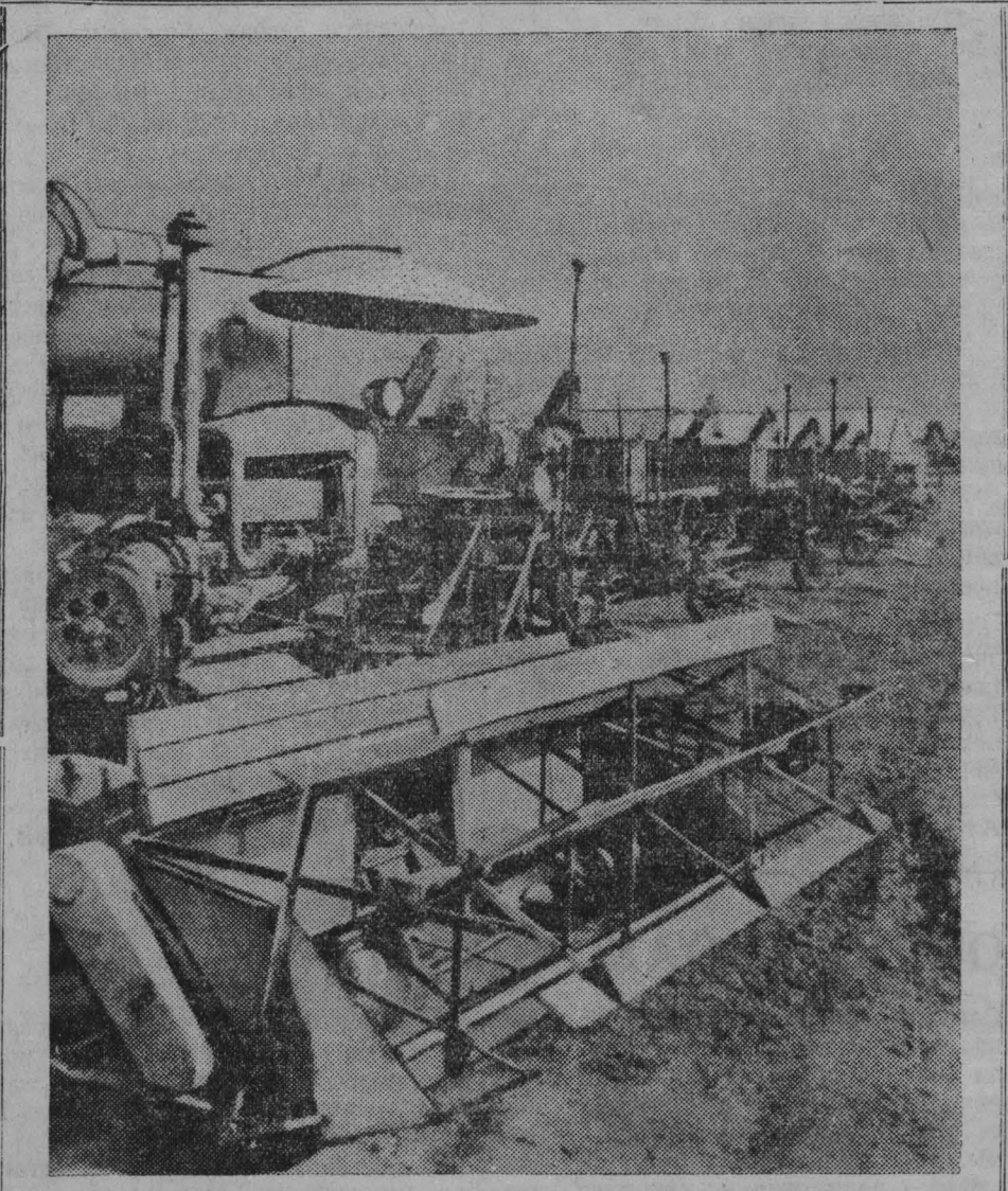
Елькаевская МТС Кемеровского района, на снимке: отремонтированные комбайны.