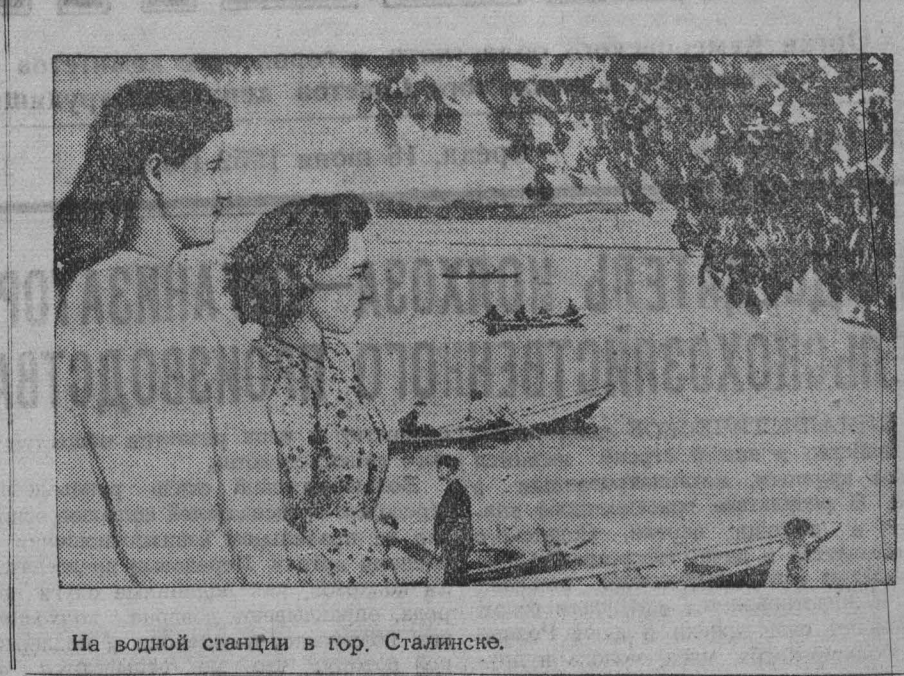
На водной станции в гор. Сталинске.