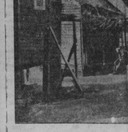
США. Подготовка к войне, проводимая империалистическими кругами, резко ухудшает положение трудящихся. Согласно преувеличенным официальным данным, не менее 13 миллионов американских семей нуждаются в жилищах. Кроме того, миллионы бельевых живут в полуразвалившихся домах и лачугах. НА СНИМКЕ: ветхий лачуги, находящиеся недалеко от университета города Атланты.

В ответ на этот призыв во Франции прокатилась мощная волна забастовок. Несмотря на штрейкбрехерскую деятельность желтых лидеров ревизионистских профсоюзов, забастовка в Париже приняла особенно широкий размах. Массовые забастовки прошли в Марсе