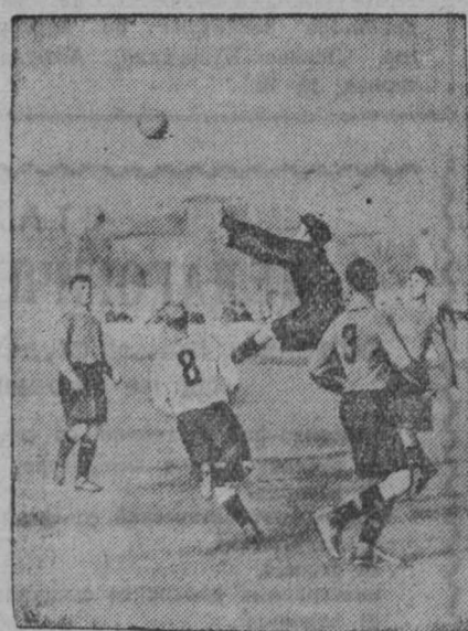
НА СНИМКЕ: момент игры на кубок города Кемерово по футболу.

28 мая в г. Сталинске на стадионе «Металлург» состоялось состязание на первенство РСФСР по футболу между