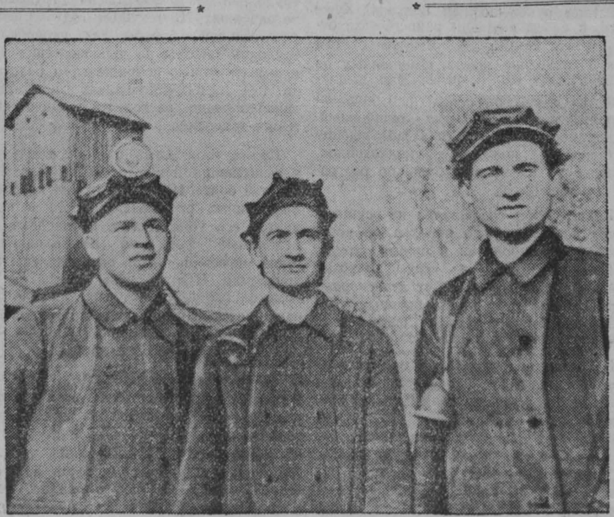
Комбайнеры шахты «Польсаевская-1» в апреле добились наивысшей добычи угля на комбайн «Донбасс» — 21.400 тонн.