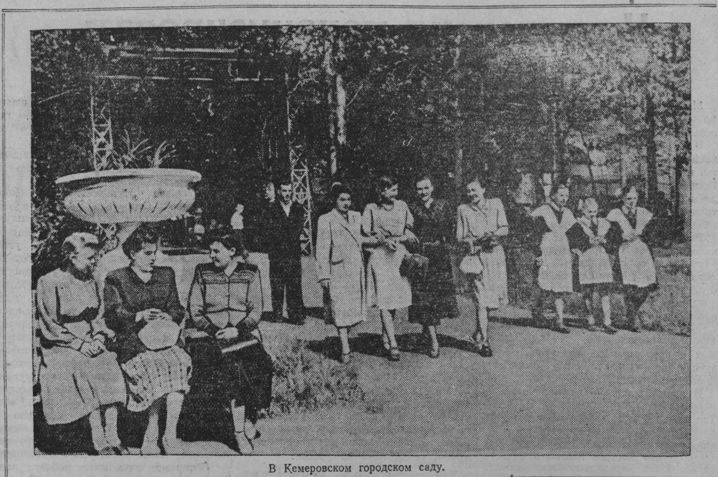
В Кемеровском городском саду.

25 мая в Москве на центральном стадионе «Динамо» состоялось заключительное соревнование на первенство Европы по баскетболу 1952 года для женских команд. Шесть дней сборные женские баскетбольные команды 12 стран Европы упорно боролись за почетное звание чемпионок. Первыми 25 мая вышли на площадку команды Румынии и Финляндии. Состязание между ними закончилось со счетом 41:35 в пользу румынских баскетболисток. Команда Франции со счетом 46:31 одержала победу над спортсменками Швейцарии. С большим подъемом баскетболистки Болгарии провели встречу со сборной командой Польши и выиграли состязание со счетом 70:36.