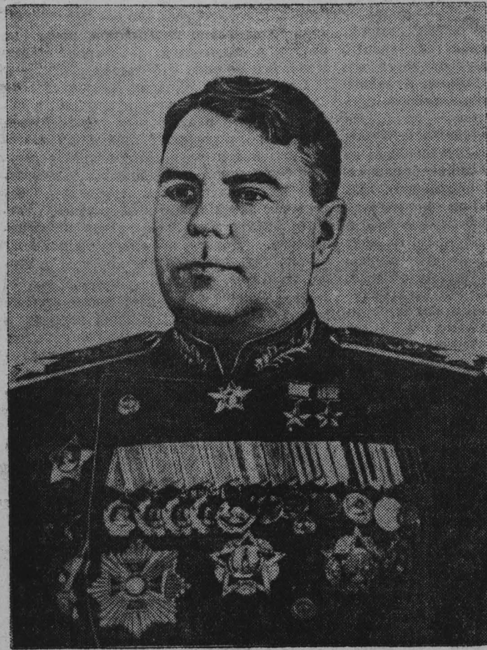
Военный Министр Союза ССР Маршал Советского Союза А. М. Василевский.

Под знаменем Ленина, под водительством Сталина — вперед, к победе коммунизма!