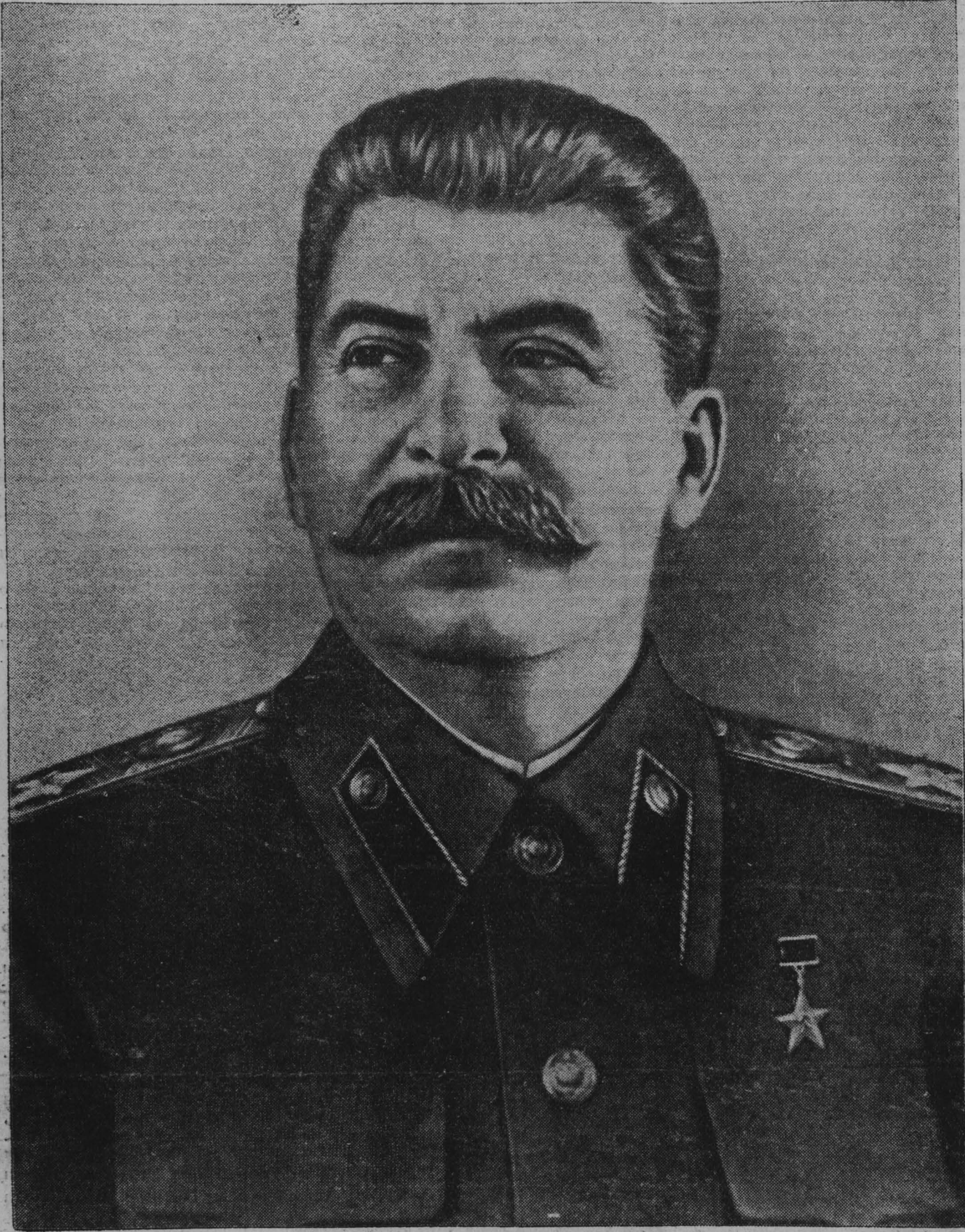
Иосиф Виссарионович СТАЛИН.