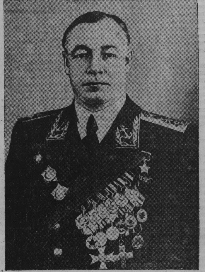
Военно-Морской Министр Союза ССР, вице-адмирал Н. Г. Кузнецов.