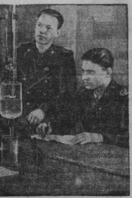
КЕМЕРОВСКИЙ ГОРНЫЙ ИНСТИТУТ. НА СНИМКЕ: студенты на лабораторных занятиях.