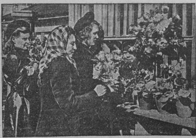
В питомниках и оранжереях гор. Прокормовка выращивается большое количество разных цветов. Оранжерейные и комнатные цветы уже поступили в продажу для населения. НА СНИМКЕ: в цветочном киоске.