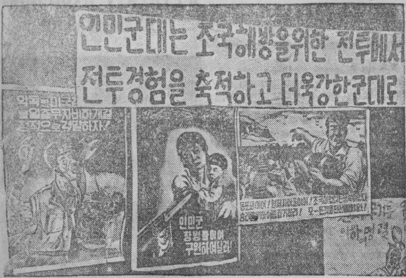
Корейская Народно-Демократическая Республика. Памятки на улицах одного из корейских городов, призывающие к защите детей от американских зверств и к усилению выработки боеприпасов.