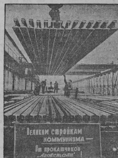
ЖДАНОВ. Рельсо-балочный цех — передовой на заводе «Азовсталь». Недавно цех получил срочный заказ для канала Волга—Дон. Заказ прокатчики выполнили за двое с половиной суток вместо четырех по плану.

НА СНИМКЕ: погрузка рельсов в адрес великих строек коммунизма.