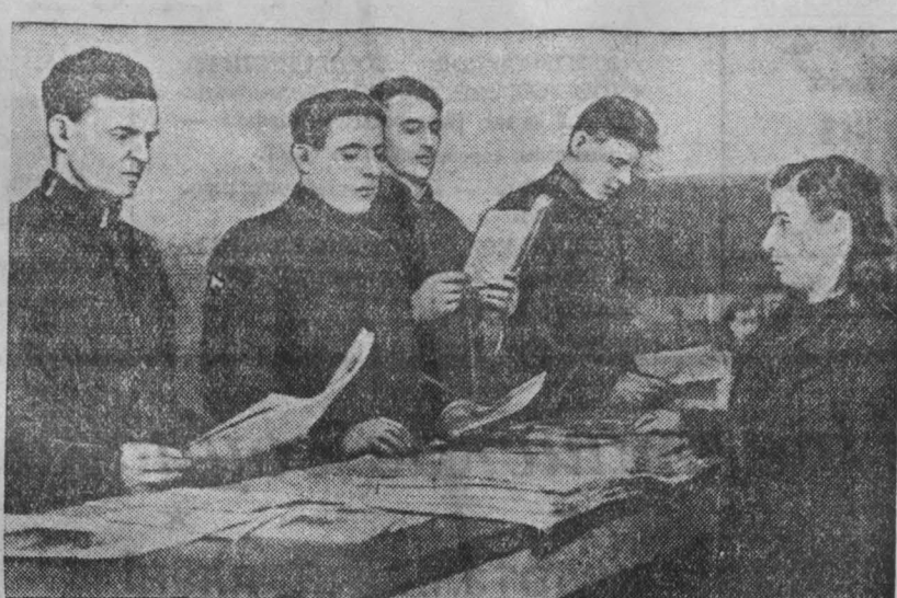
коллектив художественной самодеятельности Дворца культуры имени Артема. СПРАВА: в раскомандировке шахты имени Сталина есть хороший книжок «Союз» новинки технической и художественной литературы.