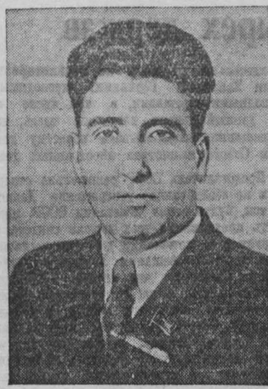
Мирза Ибрагимов, писатель. Премия присуждена за роман «Наступит день».