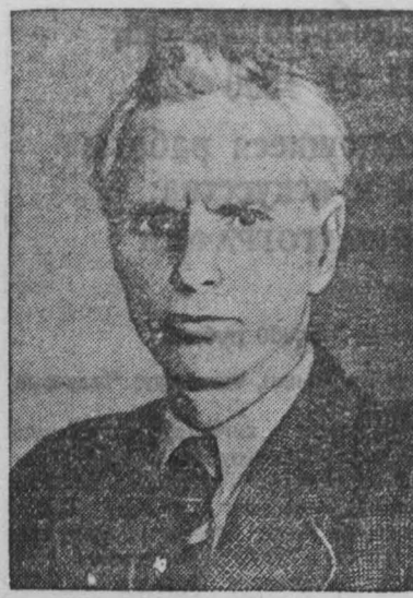
С. П. Шипачев, поэт. Премия присуждена за поэму «Павлик Морозов».