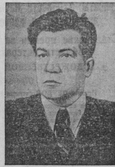
А. В. Кожевников, писатель. Премия присуждена за роман «Живая вода».