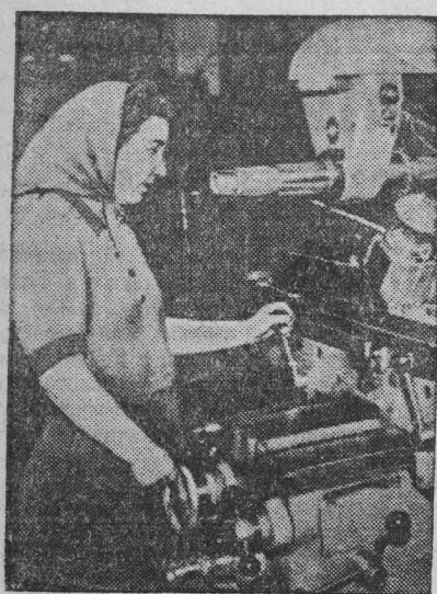
Работница чехословацких предприятий активно участвует в производственной жизни. На заводе имени Яна Шворны в г. Брюно растет число ударниц-многостаночниц, показывающих образцы самоотверженного труда.