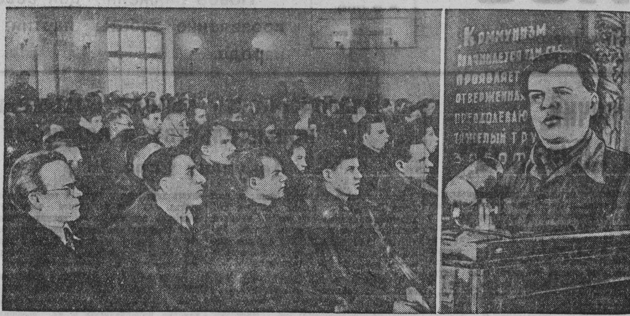
С огромной радостью встретил коллектив азотно-тукового завода (г. Кемерово) постановление Совета Министров СССР и ЦК ВКП(б) о новом снижении цен. В клубе завода состоялся митинг, посвященный этому важному событию. Коллектив принял на себя повышенные трудовые обязательства.