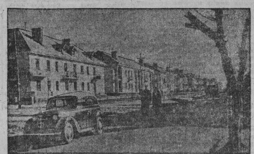
Украинская ССР. В Запорожье за последние три года построен новый рабочий поселок. Здесь выросли десятки жилых домов общей площадью свыше 50,000 квадратных метров. На снимке: улица Победы в новом рабочем поселке. Фото А. Красовского. (Фотохроника ТАСС).

ЯРОСЛАВЛЬ. Коллектив Ярославского автомобильного завода в 1950 году освоил производство грузовых автомобилей-самосвалов для перевозок песка и камня. Первая партия машин отправлена на стройку Волго-Донского канала. Самосвалы уже прибыли на место строительства и приступили к работе. С первых дней 1951 года завод приступает к серийному выпуску грузовиков-самосвалов для сталенических новостроек. 2 января (ТАСС).