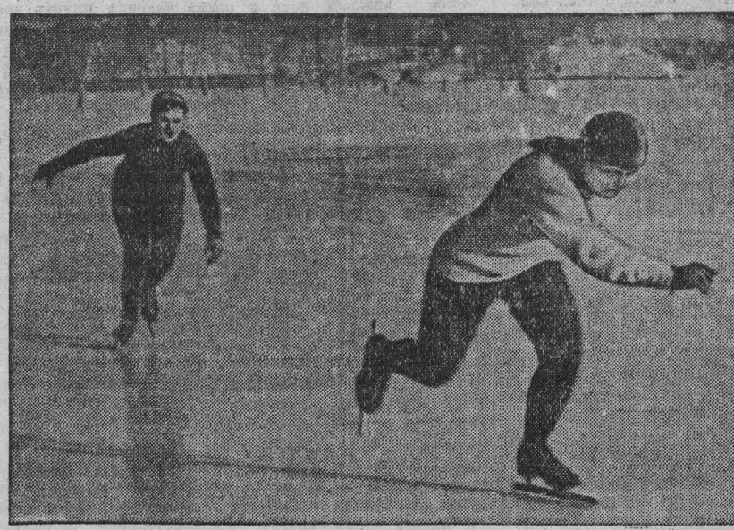
Каждый день на кемеровском стадионе спорта «Химик» проходят тренировки конькобежцев и хоккеистов. Вот скороходы областного центра в одном из забегов на 1000 метров.