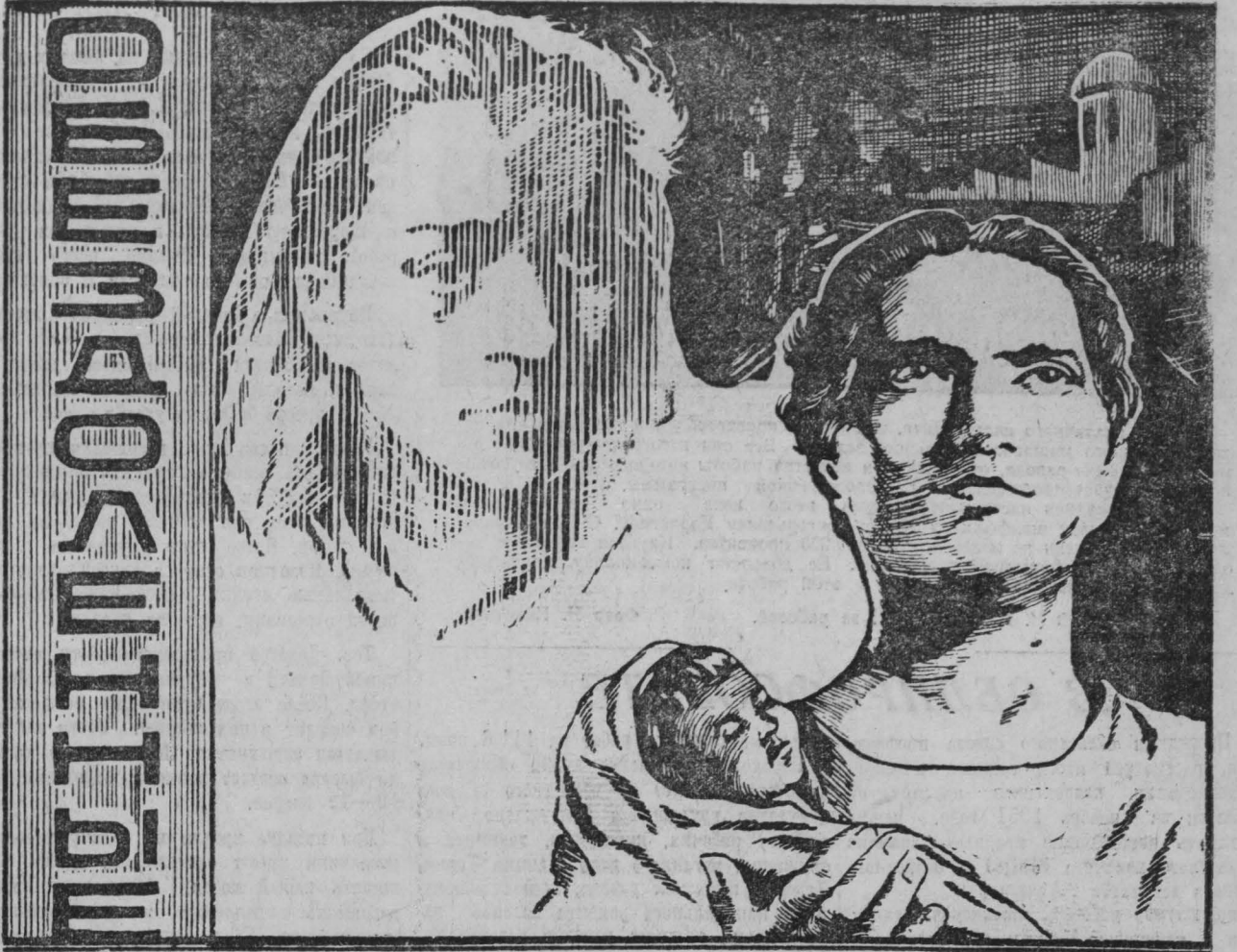
Выпуск «Главкинопроката», 1951 года.

выпускает на экраны кинотеатров Кузбасса новый художественный фильм