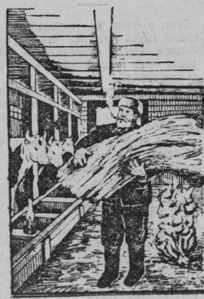
КАК НЕ ДОЛЖНО БЫТЬ!

В помещениях для скота не храните более светочной потребности фуража и подстилочного материала. На фермах и скотных дворах должно быть круглосуточное дежурство работников ферм.