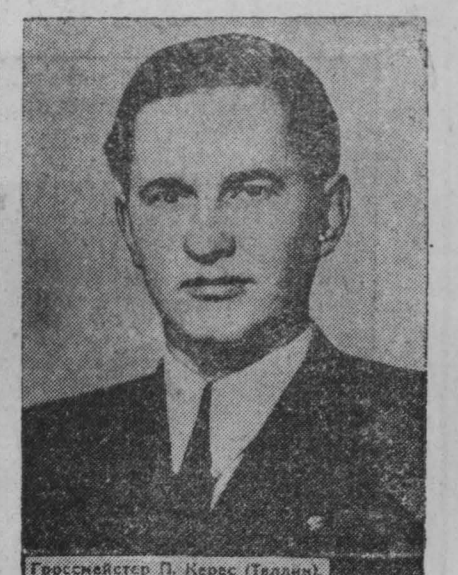
Гроссмейстер П. Керес (Талин).